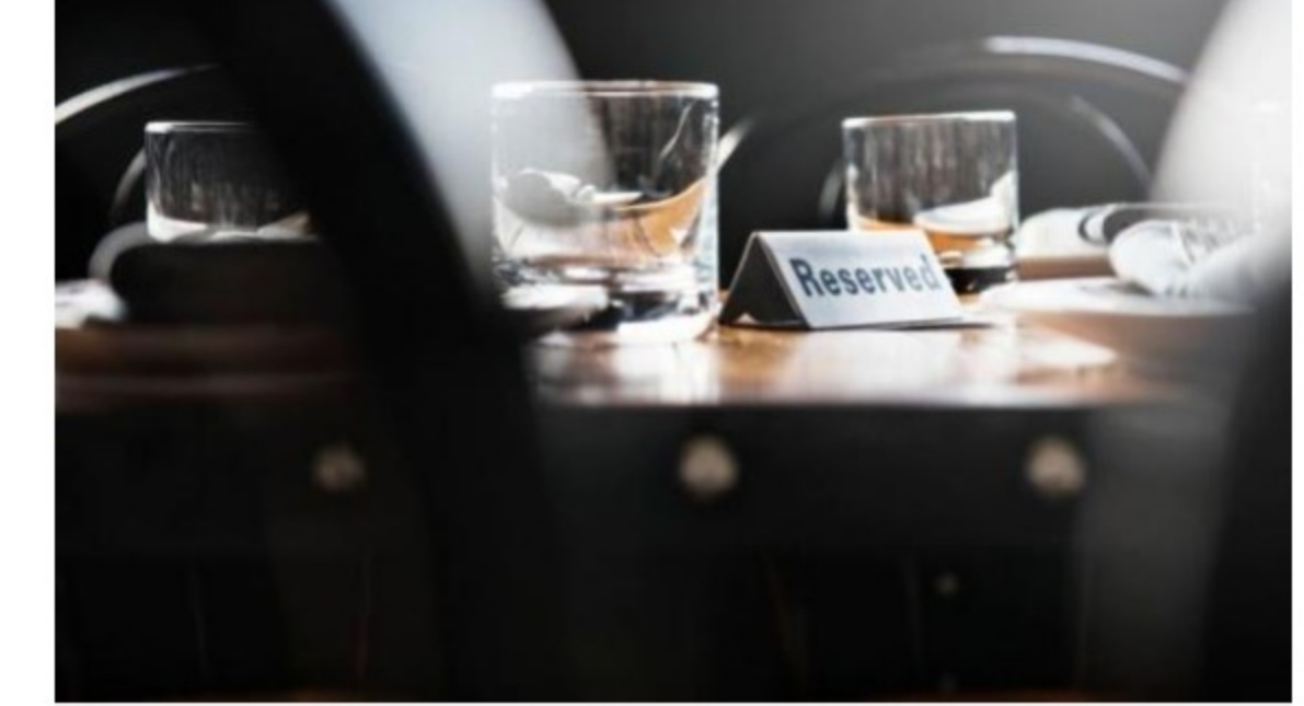
Els negocis poden acollir-se al dret d'admissió

En aquest sentit, la majoria són condicions relacionades amb la vestimenta com prohibir l'accés amb determinades sabates o peces de roba; o en normes a l'interior del local com, per exemple, no permetre l'ús de cigarretes electròniques o la celebració de comiats de solter o soltera. "Això és legítim", concreta l'advocat.