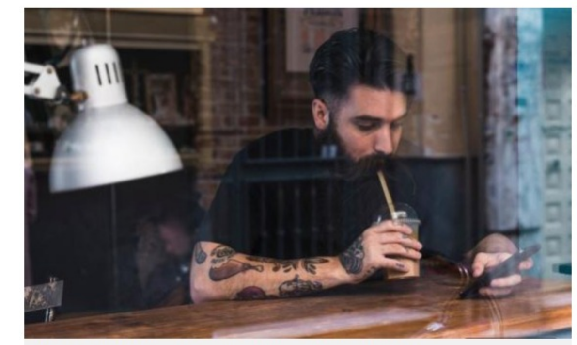
Et poden prohibir l'accés a un establiment pels tatuatges

I la resposta és que sí, poden. Gabriel Capilla confirma que "sí que es pot posar algun tipus de limitació ". Per exemple, "si són molt ostentosos o si vols fixar que no siguin visibles". Pot ser que prohibeixin l'accés a qualsevol persona amb tatuatges o a alguns dissenys concrets, tot dependrà "del local i la filosofia del negoci perquè, al final, estem parlant d'activitats privades i qui porta el negoci és qui decideix quina línia segueix".