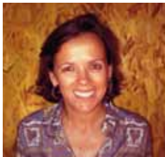
Verónica Ollé Sesé Magistrada suplent del TSJ de Catalunya

L'impacte de la Llei 13/2009 en l'ordre jurisdiccional social té característiques pròpies. Les dites singularitats poden ser resumides en la forma següent: