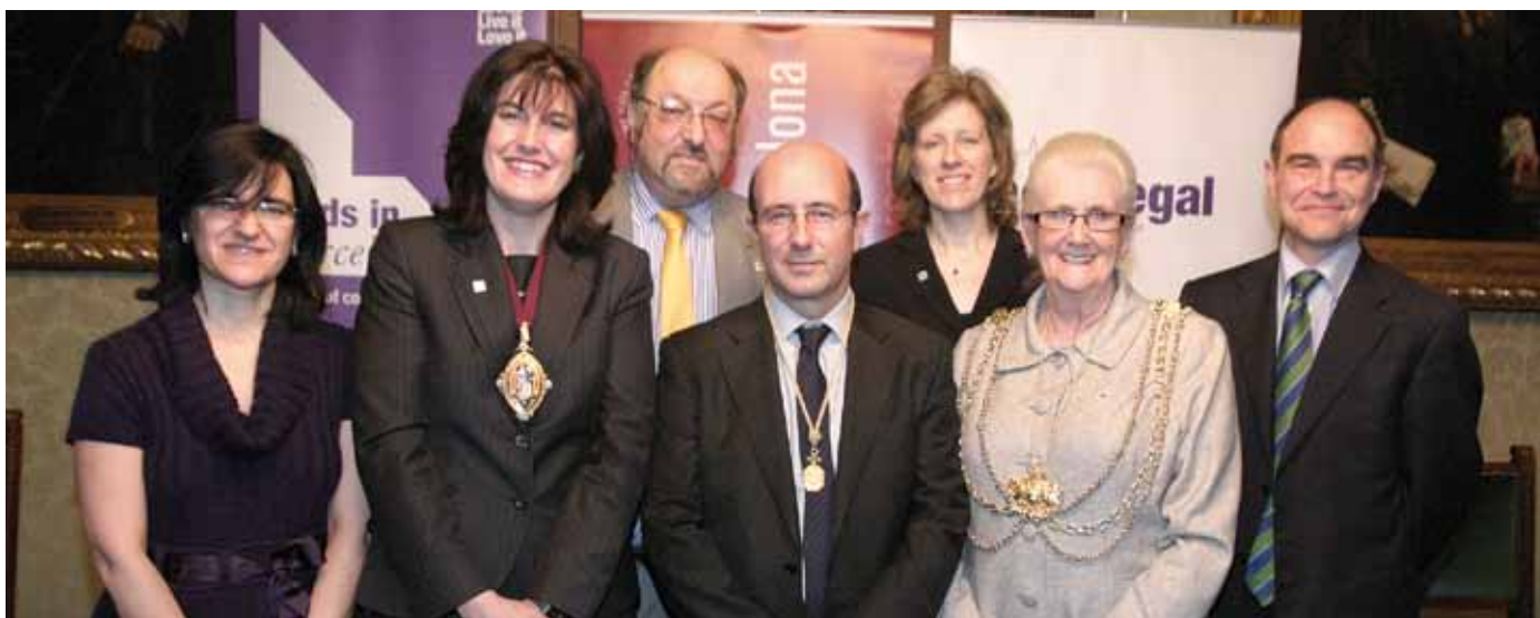
23 de març. Signatura de conveni ICAB-Advocats de Leeds per a formació en management i intercanvi d'advocats. L'endemà va tenir lloc el seminari Successful marketing of a Law Firm.