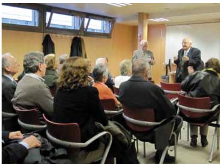
25 de març. Cinefòrum Sèniors. Projectió de la pel·lícula « Testigo de cargo »