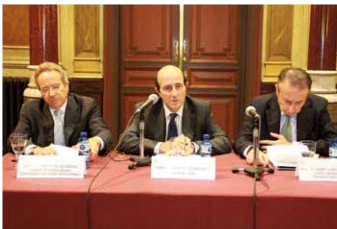
28 de setembre. Primera Trobada de l'ICAB amb el cos consular de Barcelona.