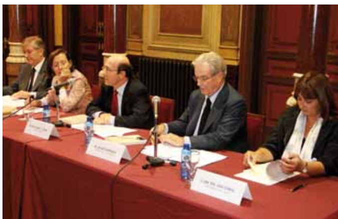
21 de setembre. Presentació: 'Llibre d'Estil Jurídic' editat en català per Editorial Aranzadi i elaborat per Garrigues.