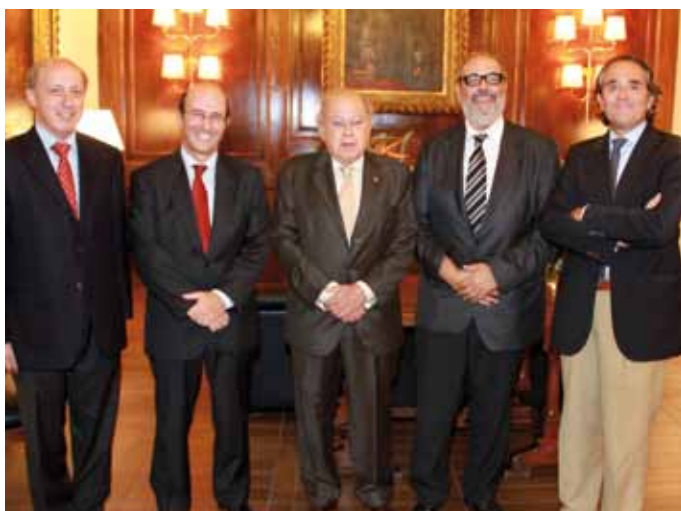
13 de setembre. Membres de la Junta de Govern reben el President Pujol.