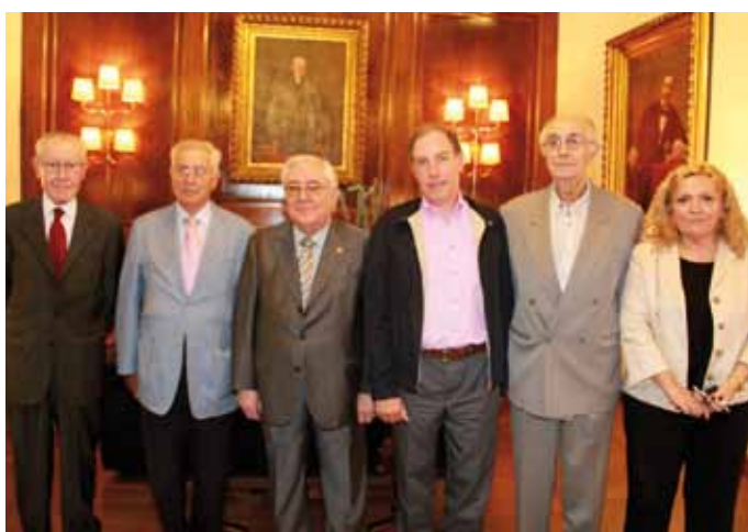
22 de setembre. Trobada de la comissió d'advocats Sèniors.